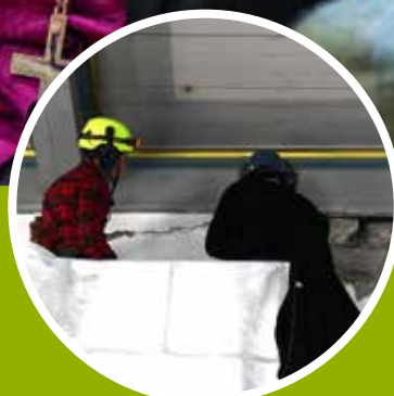
Sprekker i Selbu kirke utbedres s. 12