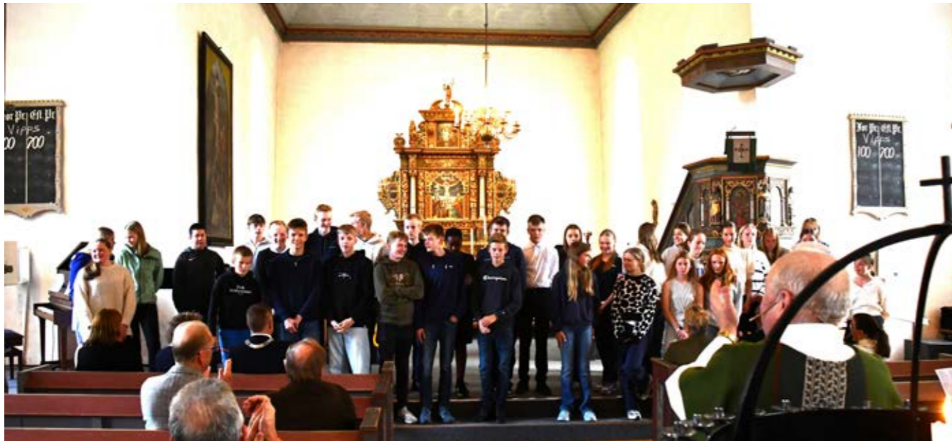
En fin bukett med ungdommer ble presentert som konfirmanter i Selbu kirke.