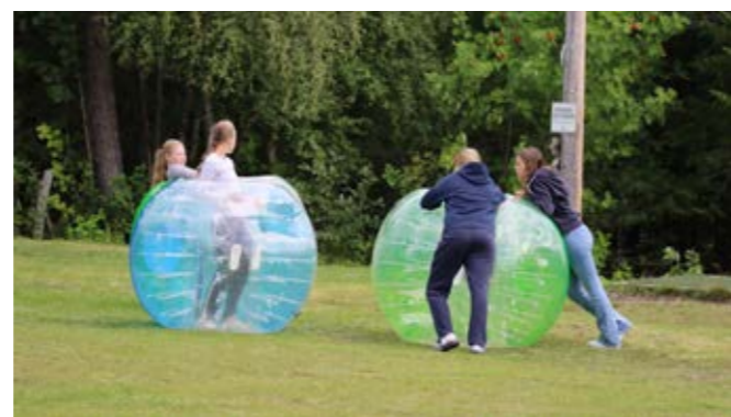
Boblefotball er artig og ufarlig action med god polstring.