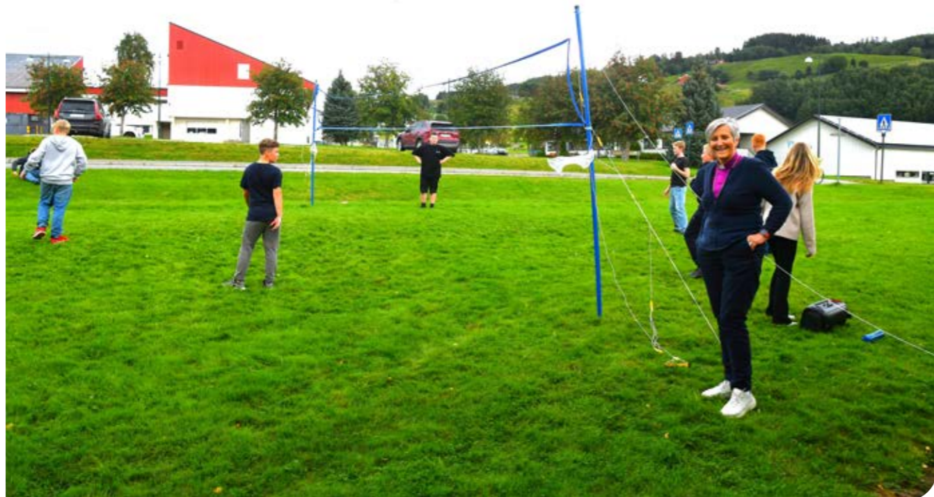
Biskopen fikk møte fine ungdommer i ungdomsklubben, og fikk også med seg et oppgjør på volleyballbanen.