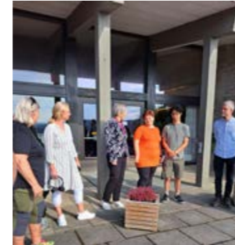
Biskop Herborg Finnset ønskes velkommen til Peder Morset Folkehøgskole.