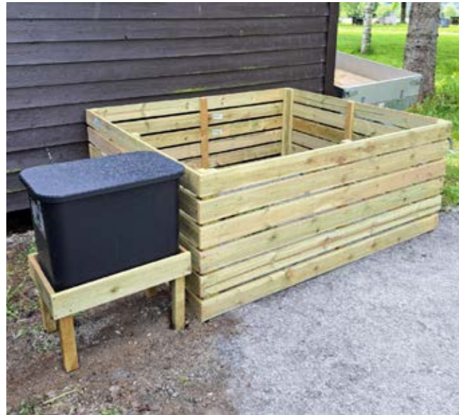
Disse bingene og containerne er kun beregnet for avfall fra kirkene og gravplassene, og er ikke mottak for privat avfall.

I sommer ble det igangsatt kildesortering av avfall ved gravplassene i Selbu. Etter et knapt halvår viser det seg at dette har slått feil ut. Avfallscontaineren og bingen blir brukt av private, hyttefolk og bobilturister. Særlig på Selbustrand har disse vært misbrukt.