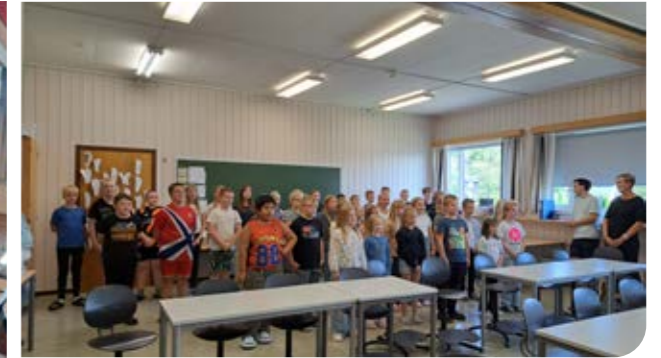
Elevene ved Selbustrand skole var godt forberedt da de møtte biskopen.

Dag 3 av bispevisitasen var i stor grad viet skolebesøk. Første stopp var Peder Morset Folkehøgskole, hvor biskopen også fikk spise lunsj sammen med elevene og skolens ansatte.