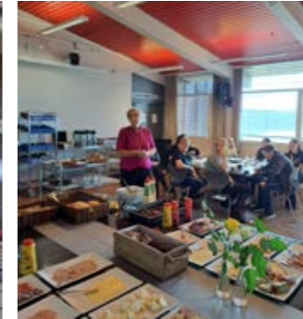
Lunsj med elever og ansatte ved Peder Morset Folkehøgskole.