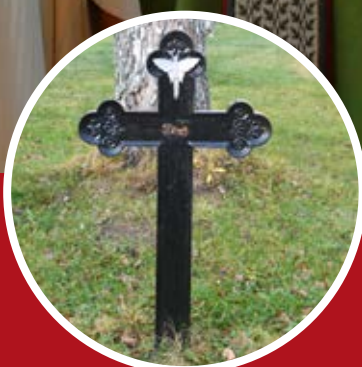
Unavnet stålkors utenfor Selbu kirke s. 18