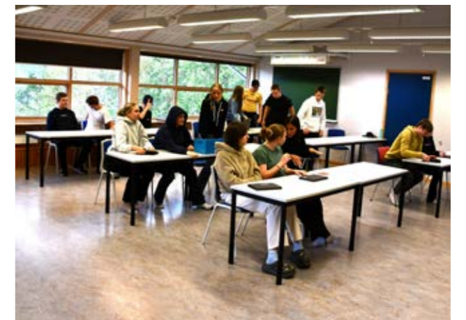
Biskopen og prosten møtte engasjerte elever og fikk mange gode spørsmål under skolebesøket i Tydal.