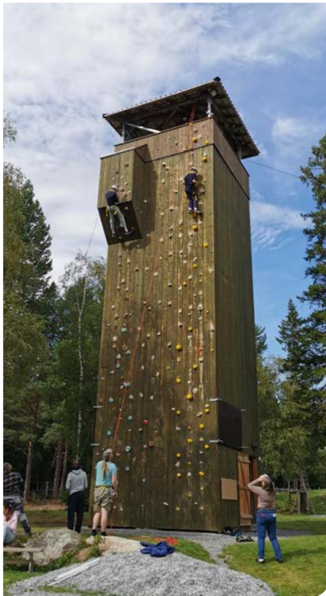
Mjuklias klatretårn var populært på leir. Nå utreder prestene hvordan man kan få montert klatrevegg utenpå tårnet i Selbukirka. Der kan folk inviteres til søndagsklatring, slik som i det populære kirketårnet i Sydhavn sogn, København.