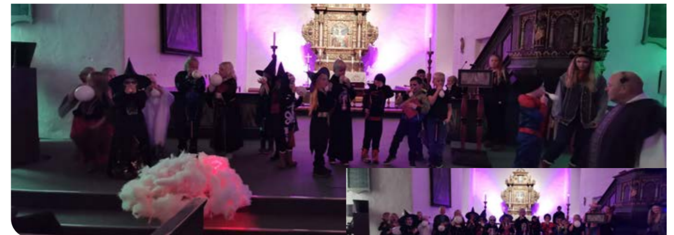
Tekst og bilder: Lisbeth Sørflakne

Vi har gitt ut bøker i både Selbu og Tydal. I Tydal blir alle 4, 5 og 6-åringer invitert, og i Selbu blir 4 og 6-åringer invitert. De får delta i en gudstjeneste og bøker. Prest Jan Olav hadde mistet en sau som vi måtte lete etter, og fortalte oss at ingen er for liten eller ubetydelig i Guds øyne.