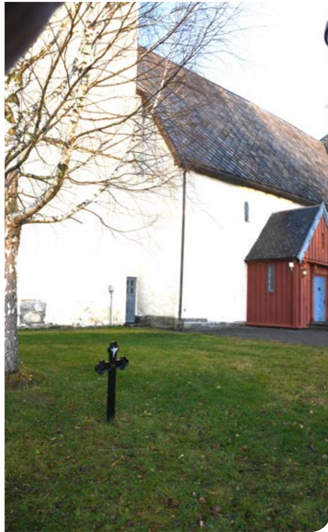
Det navnløse korset ved Selbu kirke har sin oppgave ved bisettelser der avdøde ikke føres til en grav. Tiltaket er godt mottatt.

Flere har reagert på at det står et jernkors uten navn på et område av kirkegården der det ikke fins graver. Korset er plassert der med viten og vilje, og har en oppgave.