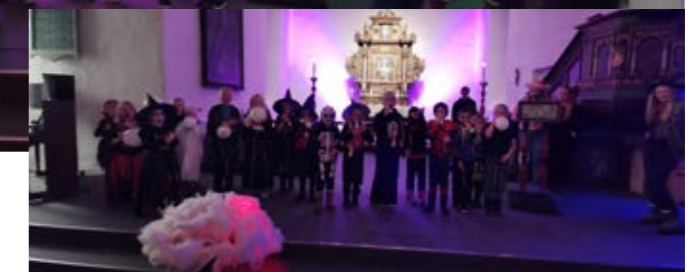
utkleddede barn med 6-årsboken sin

6-årsboka i Selbu ble gitt ut under en Halloween-gudstjeneste. Da var alle barn invitert og kunne kle seg ut. Etter gudstjenesten bar det ut på kirkegården, der det via poster ble snakket om hva det betyr å være redd, døden og lyset. I tillegg snakket vi om likhetene mellom Allehelgen og Halloween.