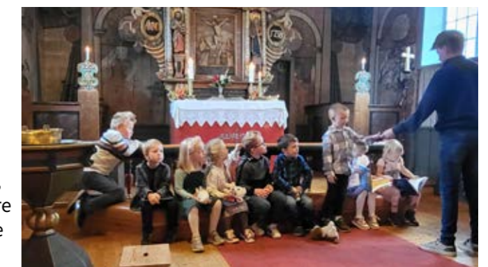
Glade unger med nye bøker