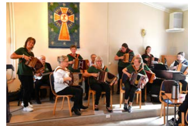
Selbu Toradergruppe underholdt under avslutningen av bispevisitasen.

Etter avsluttet visitas kom biskopen med noen utfordringer til våre kommuner og kirken lokalt, og avsluttet sitt visitasforedrag på denne måten: